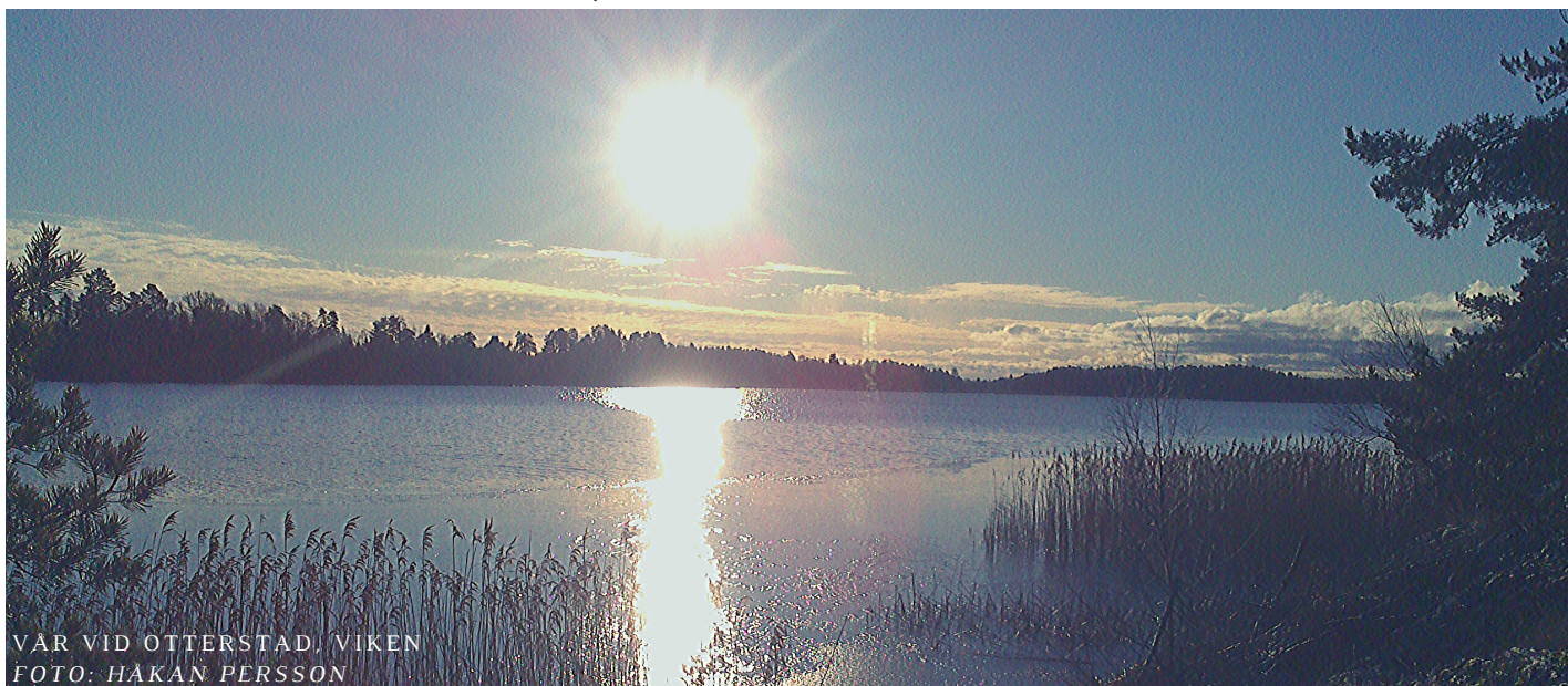
VÄR VID OTTERSTAD, VIKEN