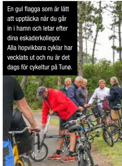
En gul flagga som är lätt att upptäcka när du går in i hamn och letar efter dina eskaderkollegor. Alla hopvikbara cyklar har vecklats ut och nu är det dags för cykeltur på Tunø.