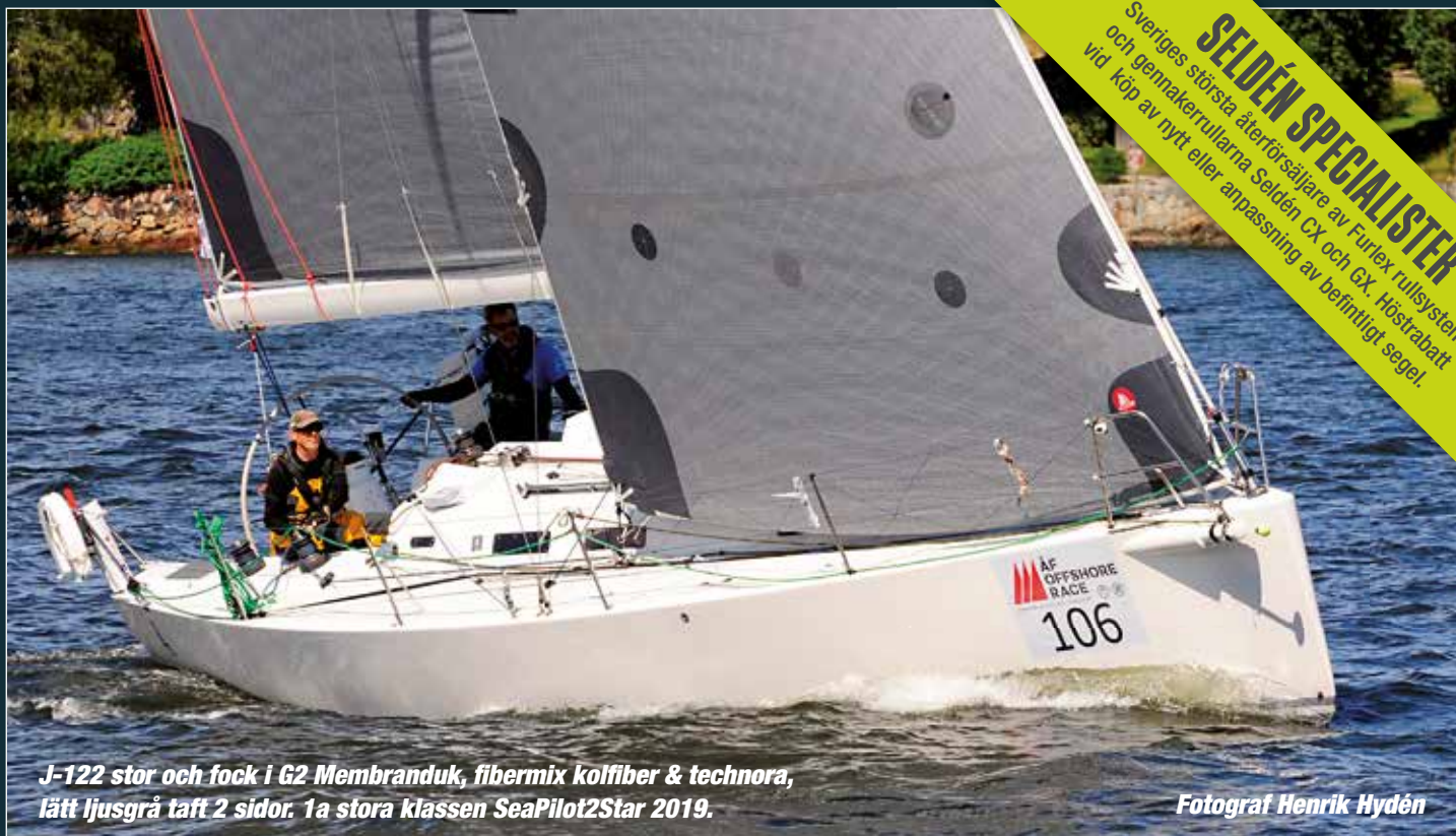
J-122 stor och focck i G2 Membranduk, fibermix kolfiber & technora, lätt ljusgrå taft 2 sidor. 1a stora klassen SeaPilot2Star 2019.