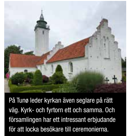
På Tunø leder kyrkan även seglare på rätt väg. Kyrk- och fyrtorn ett och samma. Och församlingen har ett intressant erbjudande för att locka besökare till ceremonierna.

kring dagens segling. Varje besättning har dessutom på förhand lottats till att vara hamnvårdar för en hamn var, vilket i praktiken innebär att vi fixar något kul som inträffar efter det dagliga skepparmötet. Så, förutom att lära känna våra seglarvänner bättre och bättre för varje kväll, har vi lärt oss en hel massa vi inte visste om dansk kultur, geografi, design, segling, omöjliga knopar och historia. Detta har vi serverats via musik-quiz, tipsrundor, restaurangbesök och historiska vandringar. När vädret tillät, vilket det gjorde alla kvällar, gick grillen varm. Speciellt den gasolgrill som besättningen på Berine glatt lånade ut. Enda undantaget var i Assens där middagen avnjöts på en förnämlig restaurang med enbart lokala råvaror på menyn. De möblerade snabbt om för att göra plats för hungriga seglare som behövde vila upp sig efter en krävande poängkubb organiserad av Vegas besättning.