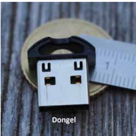
Den nya dongeln med licens för sjökorten.

En ny version av navigationsprogrammet OpenCPN kom under våren, version 5.0. Det är en del ändringar i utseendet på ikoner och nytt är möjlighet att ha delad skärm samt en del andra förbättringar. Programmet är gratis.