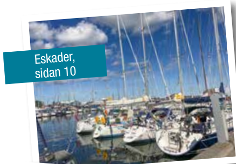
Eskader, sidan 10