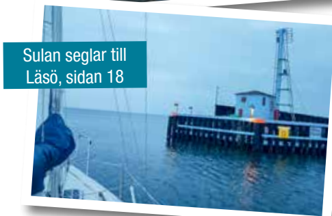
Sulan seglar till Läsö, sidan 18