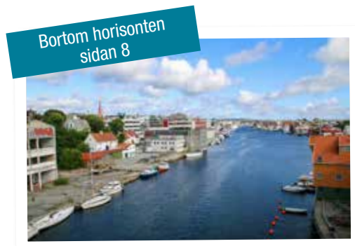
Bortom horisonten sidan 8