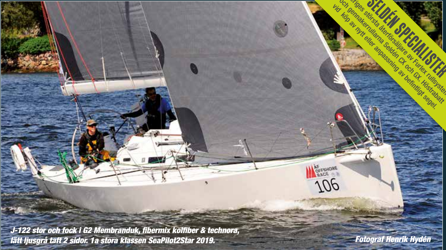
J-122 stor och fock i G2 Membranduk, fibermix kolfiber & technora, lätt ljusgrå taft 2 sidor. 1a stora klassen SeaPilot2Star 2019.

SELDÉN SPECIALISTER Sveriges största återförsäljare av Furlex rullsystem och gennakerrullarna Seldén CX och GX. Höstrabatt vid köp av nytt eller anpassning av befintligt segel.