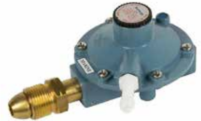
Bild 2. Exempel på CE-godkänd marin regulator märkt tydligt med Marine.

ISO 10239:2017 är den standard som nu gäller för gasolsystem i båt avsedd för bruk i saltvatten. I denna standard anger man att reduceringsventiler som uppfyller kraven i EN 16129:2013 annex M är godkända. Denna standard kräver att ventilerna bland annat skall vara märkta med texterna: EN 16129:2013 och Marine