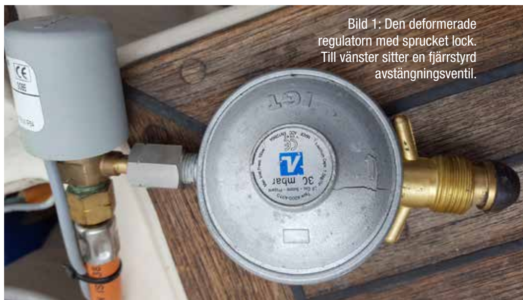
Bild 1: Den deformerade regulatorn med sprucket lock. Till vänster sitter en fjärrstyrd avstängningsventil.

Kraven är också att slangar, rör och apparater är oskadade och bytta enligt de rekommendationer som finns samt att