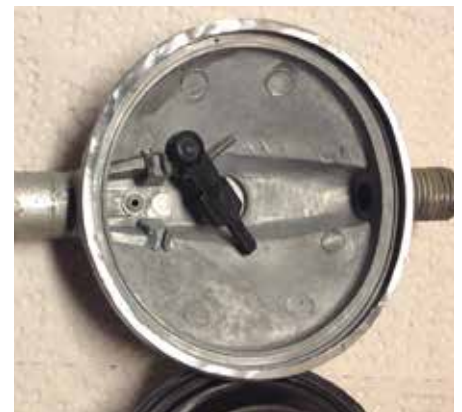
Bild 3. Den lösa regulatormekanism med sina deformerade axelfästen. Den svarta delen i mitten är hävarmen med förskjuten axel och gummipackning. Längst ner skymtar membranet.

På marknaden förekommer ventiler som är märkta EN 16129 / M (alternativt EN 16129 Annex M). Dessa ventiler uppfyller funktionskraven men har enligt Svenska Institutet för Standarder (SIS) formellt felaktig märkning.