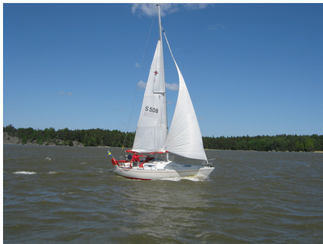
Molina med fullt revad stor och litet försegel.

Kl 9:00 lättade vi ankar och så satte vi segel och gick i frisk vind mot Hjulstabron. Sista biten upp mellan sunden blev det motorgång. Bron skall öppna 10-20 minuter efter varje heltimme. Första båt var framme 15 minuter efter timmen men gick inte ända fram för att invänta alla. Sista båt var