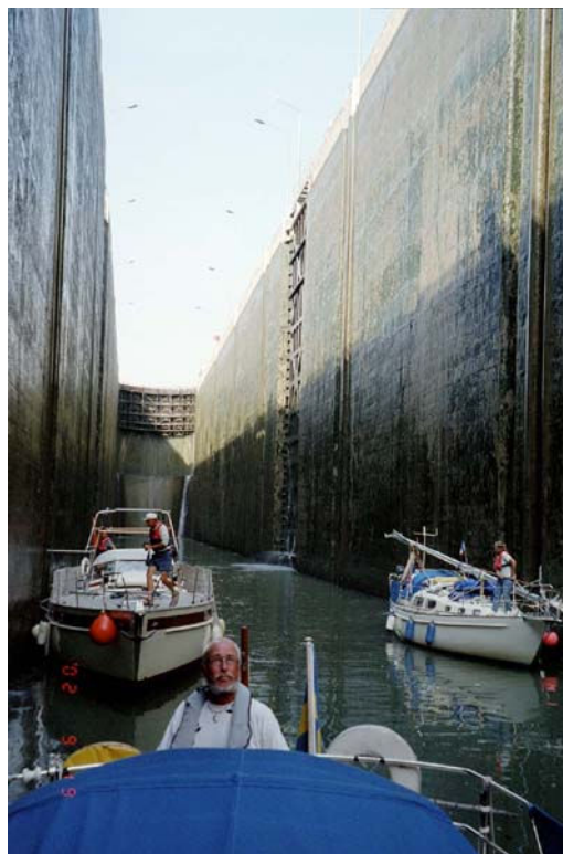
Bolleneslussen i Rhône. Slussen är 95x12 meter och 23 m hög.

Anmälan senast 8 mars till: Kjell & Birgitta Björk 021-35 70 75 e-post: kjell-birgitta@swipnet.se Entréavgift: 60 kr