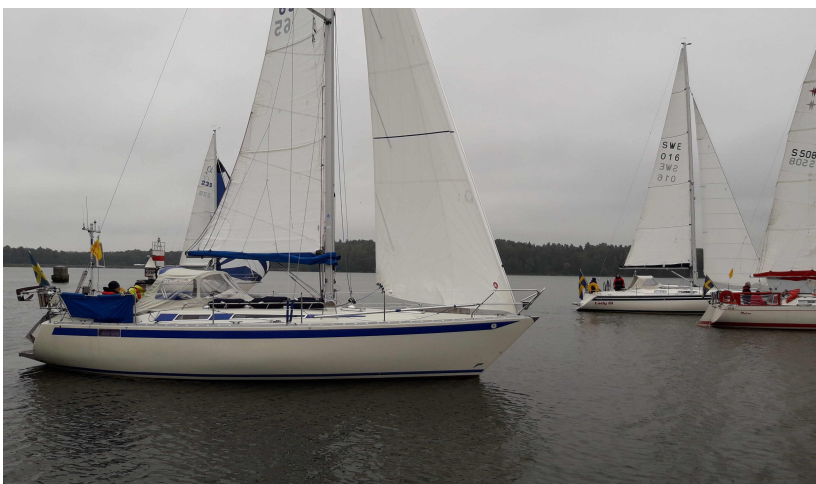
Väl samlade efter broöppningen i Hjulsta. Notera den våldsamma vinden.