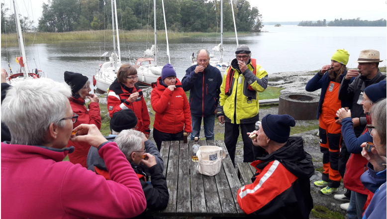
Ankomststubben tas efter tilläggning i Kyrkviken på Ängsö