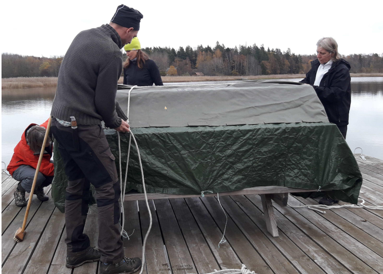
Borden ute på bryggnocken förpackades inför vintern.