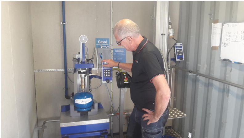
NP oljor fyller en 2012 flaska på några sekunder.

Gasolpriset varierar betydligt mellan olika leverantörer. I Västerås fyller NP oljor AB under sommarhalvåret de flesta flaskor medans man väntar. En 2 kilos 2012 flaska kostar då 150 sek medans man får betala ca 265 sek på vanliga bensinstationer. Om man har större flaskor kan Byggmax vara ett alternativ. Gå in på nätet och kolla priserna!