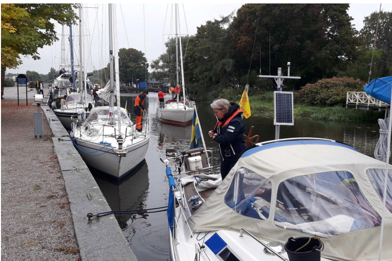
Eskadern lämnar Enköpings fina och välskyddade gästhamn.