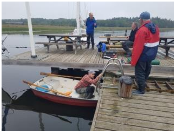
Badstegen tas upp...

I början av november var vi några kryssarklubbare som tog oss ut till uthamnen "Lövhällen" på Ridön för att ställa i ordning inför vintern. Vi täckte bl.a. möbler och tog ner flaggan vid bryggan. Vi upptäckte snart att vi hade haft besök av levande jordfräsar d.v.s. vildsvin som hade bökat upp en stor del av gräsmattan. Så till våren (Vårstädningen) har vi en arbetsuppgift att släta till densamma. Efter utfört arbete fikade vi tillsammans och tog oss med motorbåten tillbaka till Västerås igen. Det är lite vemodigt att lämna Ridön och det blir tydligt att båtsäsongen är förbi. Men när detta skrivs så är det inte långt till en ny säsong!! Snart väntar vårustning och därpå sjösättning och snart ses vi vid vår uthamn "Lövhällen" igen!!