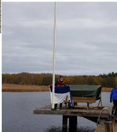
...och flaggan tas ner