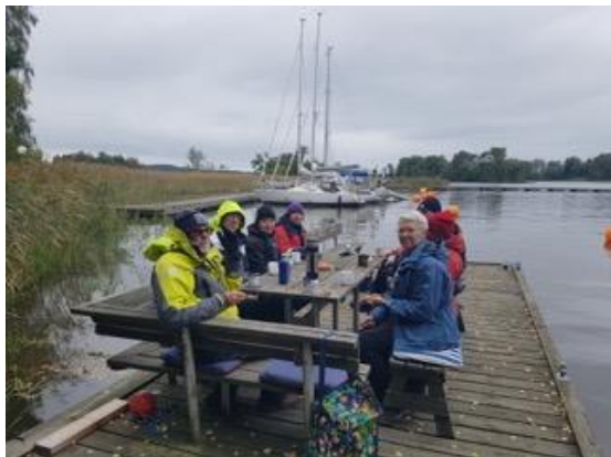
Eskaderdeltagarna på bryggan vid Lövskär innan vi fortsatte till Borgsund och Glipen

Trots det lite kyliga vädret i begynnande höst, så tror jag att alla uppskattade denna eskader som väldigt lyckad. Tidvis bra segling och trevligt umgänge i ett trevligt gäng.