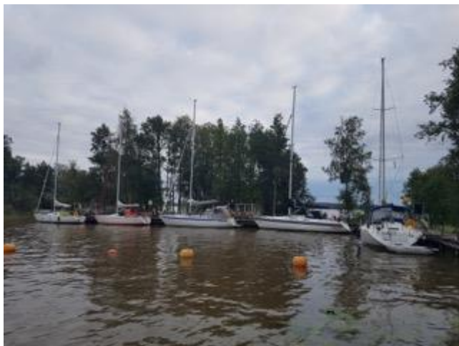
Samlade vid bryggan på Glipen