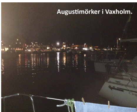
Augustimörker i Vaxholm.