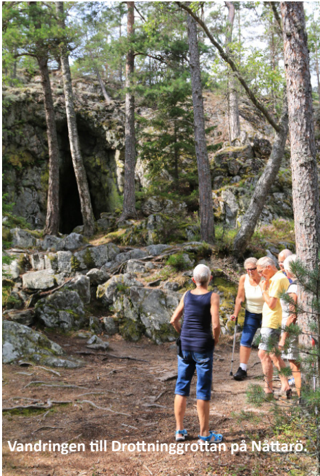
Vandringen till Drottninggrottan på Nättarö.

Vi var fyra båtar som seglade från Herrhamra till Arholma längs den yttre segelleden från 1200-talet. Vi besökte kända öar som Nättarö, Utö, Ålö, Ornö, Finnhamn och Blidö. Vi gick iland och cyklade eller vandrade till olika platser. Där vi berättade för varandra om öarnas historia, utveckling och natur med hjälp av boken "Skärgården - vägvisare från Örskär till Landsort" av Ulf Sörenson.