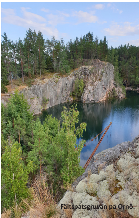
Fältspatsgruvan på Ornö.

Vi upptäckte mycket som vi tidigare bara seglat förbi på väg norrut mot Bottenviken eller österut in i Finska viken. Vi vände vid Arholma och tog den inre leden föbi Ångsö till Vaxholm. Där upplöstes eskadern. En båt seglade mot Stockholm, en långsamt söderut och två i ilfart tillbaka längs den inre leden genom Baggensstäket mot Nynäshamn och Nyköping.