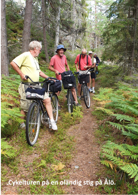
Cykelturen på en oländig stig på Ålö.