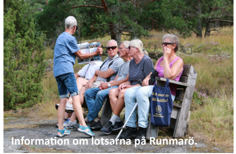
Information om lotsafna på Runmarö.