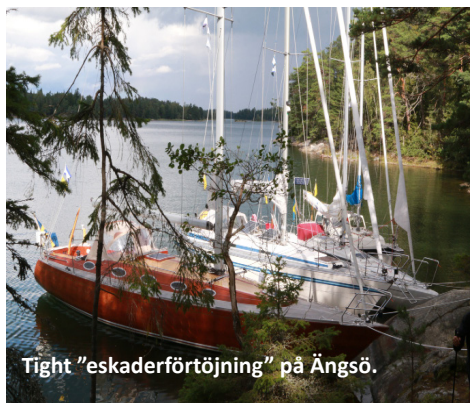
Tight "eskaderförtöjning" på Ångsö.