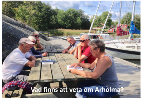
Vad finns att veta om Arholma?