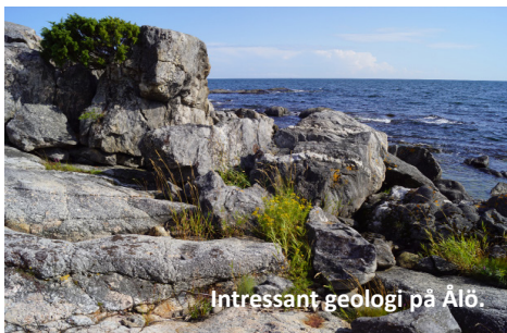
Intrigant geologi på Ålö.

En längre eskaderberättelse finns på hemsidan.