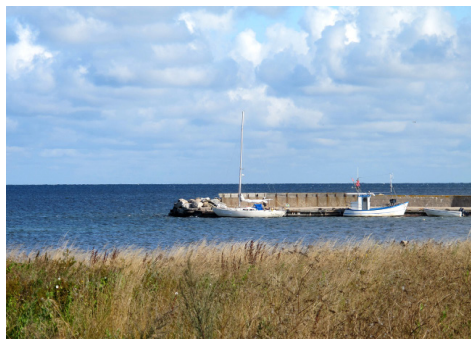
Tant Brun är förtöjd i Kappelshamn.

Båten rullade mycket och svågern fick kämpa med att både hålla sig fast och försöka hissa seglet. Det visade sig vara svårare än väntat då fockskotet snodde sig så vi avbröt försöket. En genomblöt svåger men ändå med ett leende på läpparna utbrast: "hade jag vetat hur det var där framme hade jag inte lämnat sittbrunnen!"