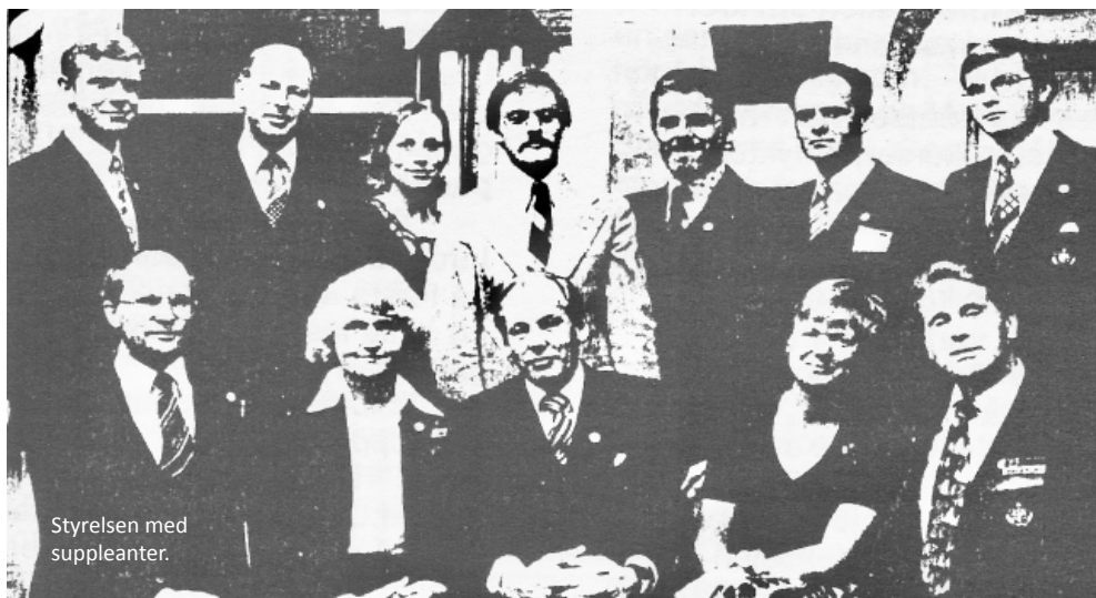
Styrelsen med suppleanter.