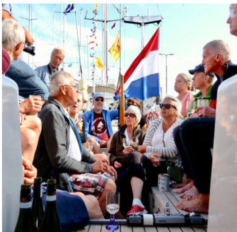
Ankomstsåll i Nexö hamn Bornholm 2017.

Då Sörmlandskretsen bildades var 24-tim-marsseglingar den aktivitet som samlade flest deltagare. Styrelsen klagde på bristan-de intresse för eskadersegling.