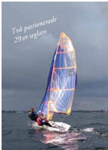
Två passionerade 29:er seglare

Det skall var trevligt att segla tillsammans. Naturligtvis kan det börja regna och blåsa till oväntat. Men vi har alltid försökt lyssna noga på väderrapporter och hellre avstå från att segla dagar med dåliga utsikter. Det finns nästan alltid något intressant att göra på land också. Bättre att förflytta sig och båten till en hamn, där man kan göra utflykter eller bara känna sig trygg i dåligt väder.