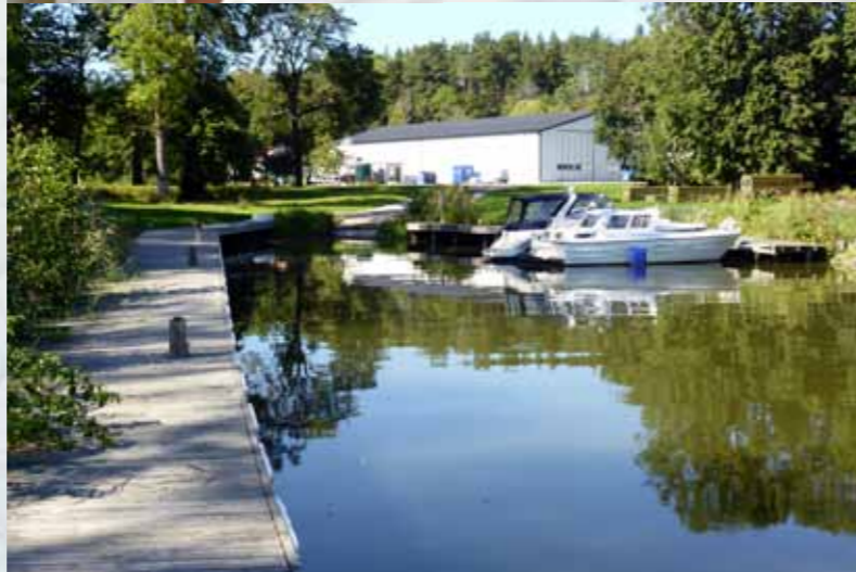
Nordin bytte Stockholm mot Enköping för att kunna jobba med sitt stora intresse: Båtar. Nu även återförsäljare för Seabung.