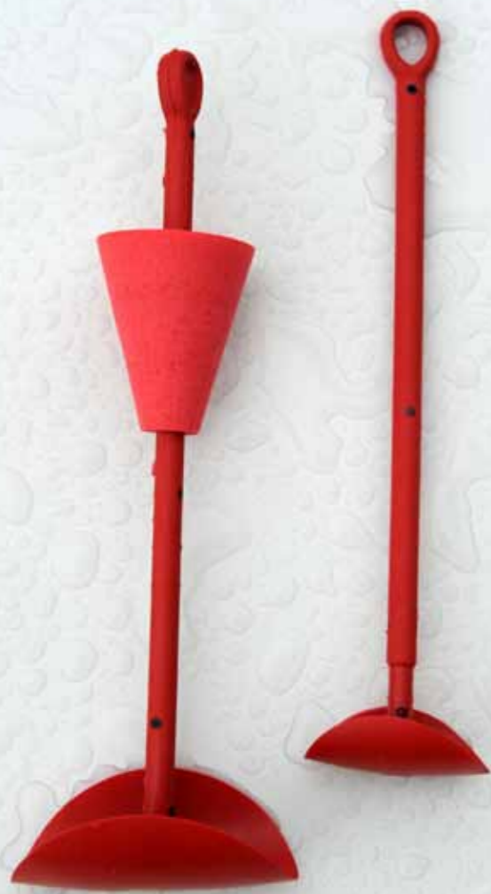
Seabung trycks ut genom en skadad skrovgenomföring och tätar med hjälp av omgivande vattentryck. Susanne Belin och Kjell