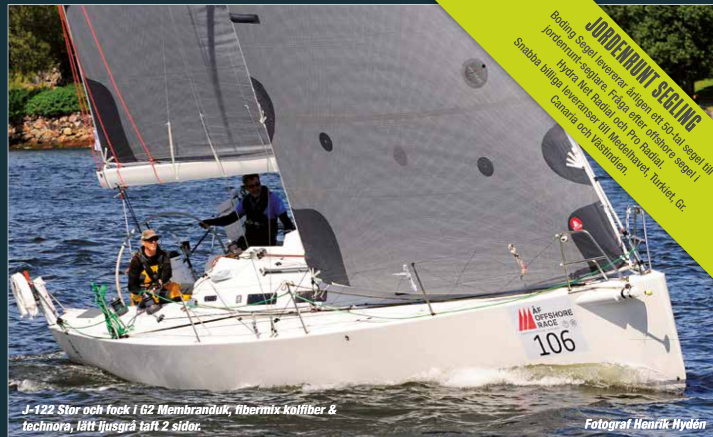
J-122 Stor och fok i G2 Membranduk, fibermix-kolfiber & technora, lätt ljusgrå taft 2 sidor.