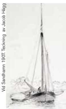
Vid Sandhamn 1907. Teckning av Jacob Hägg

Seniorkommittén i Stockholmskretsen tar nya tag. Den 16 september ordnas en utflykt till Landsort med guidning av mästerlotsen Björn Öberg. Den 21 oktober ordnas visning av Sjöhistoriskas båtsamling på Rindö.