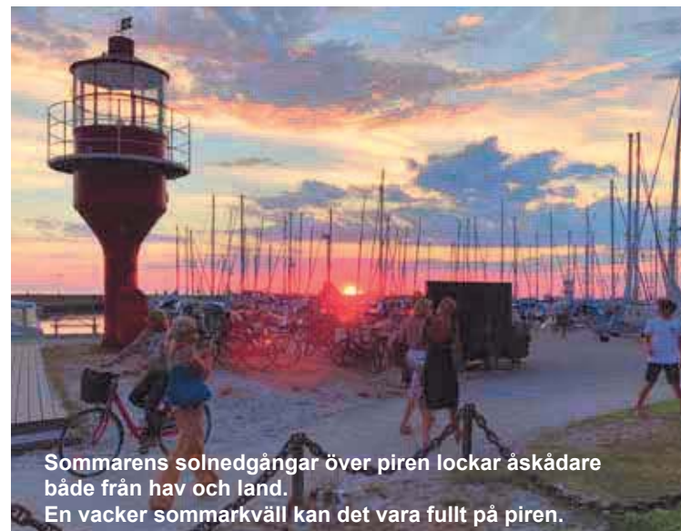
Sommarens solnedgång över piren lockar åskådare både från hav och land. En vacker sommarkväll kan det vara fullt på piren.

Med utbyggnad och modernisering av stolpar mm blir Skanörs hamn ännu charmigare än den är.