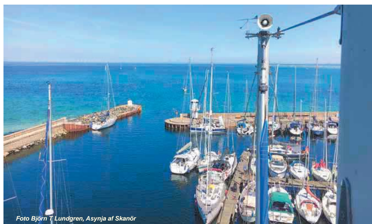
Asynja af Skanör