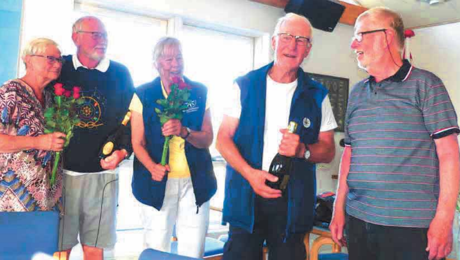
Tack till eskaderledningen