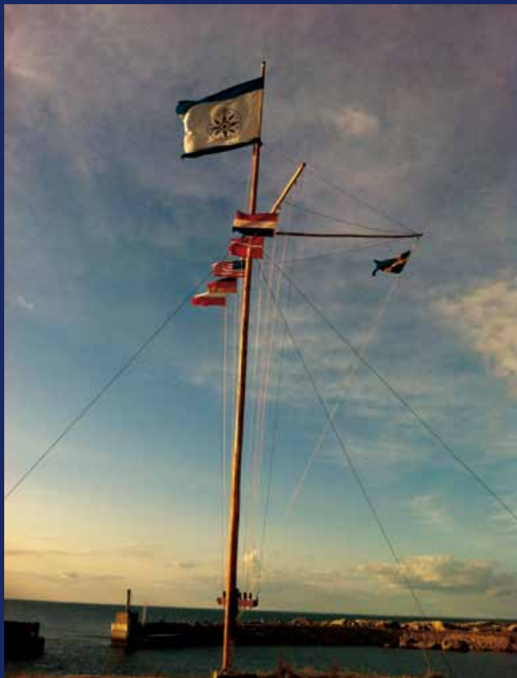
Utklippans nya flaggmast