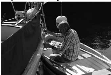
Alltid något båtpyssel

När så makthavarna bestämde att pingsthelgen inte skulle vara längre än ett vanligt veckoslut, tog kretsstyrelsen upp frågan om att ändra lite i det traditionella tänkandet. Det ansågs också viktigt att förlägga mötet till olika platser, så att det blev en bättre fördelning mellan länets östra och västra delar. Det har inneburit att mötet under senare år varit förlagt till en rad platser. Förutom till Stenshamn har mötet förlagts till Ronneby (Karön), Tromtö (flera gånger) och Järnavik. Lokala båtklubbar har alltid varit hjälpsamma med att ordna båtplatser till deltagarna i mötet och