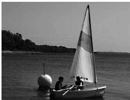
Nästa generation SXX are

När så solen sänkte sig bakom trädtopparna i väster var det dags att bryta taffeln och samlas kring kaffet i Navis trevliga klubbhus. Där fick vi så veta resultatet av tipstävlingen. De kluriga frågorna kommenterades och diskuterades under muntra former. Priset till dem som lyckats bäst var äran att bli omnämnd med sitt resultat.