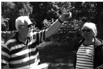
Stig visar vägen