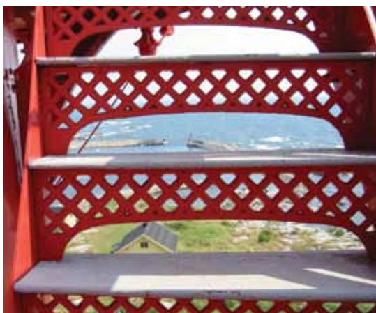
Trappan i fyren