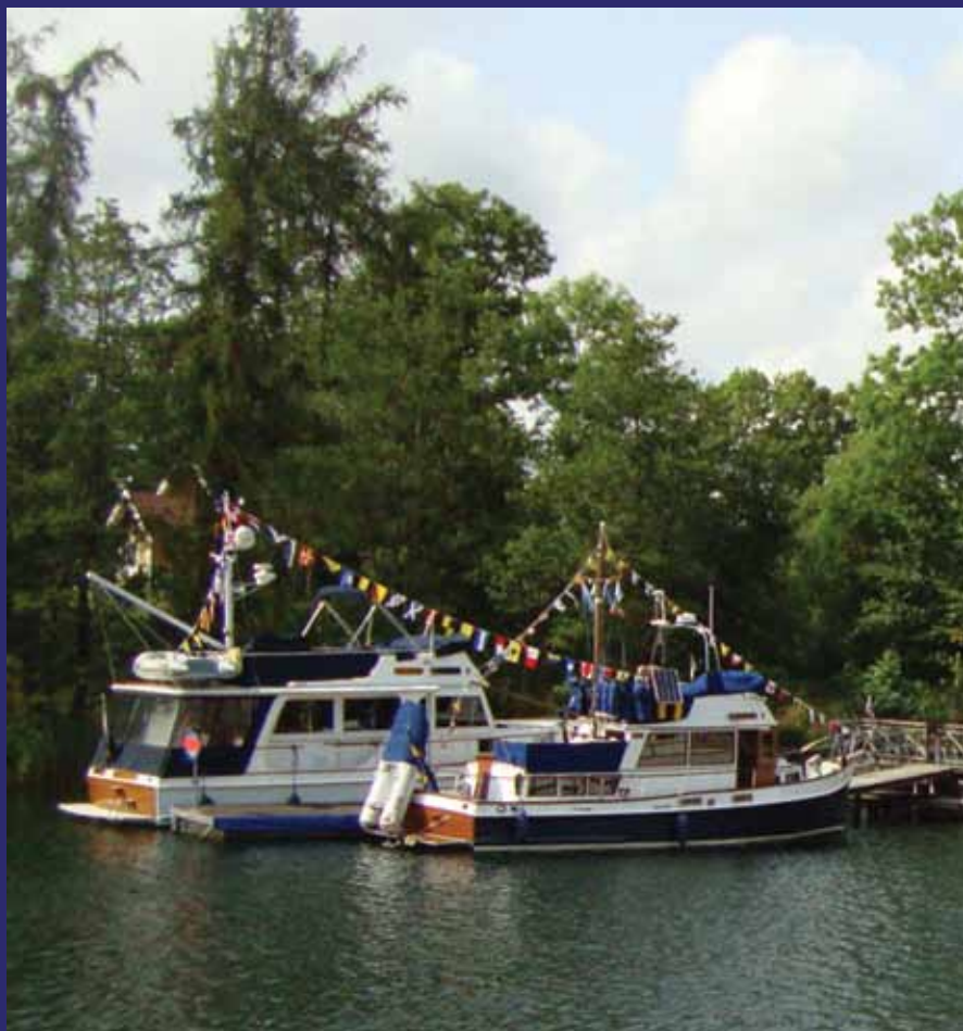
Grand Banks båtar på sommarträff i Södertälje kanal