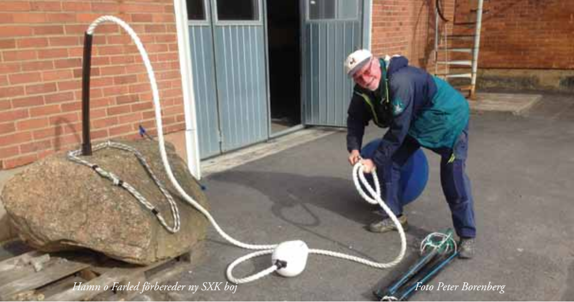
Hamn o Farled förbereder ny SXX boj