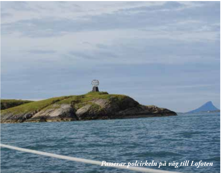
Passerar polcirkeln på väg till Lofoten