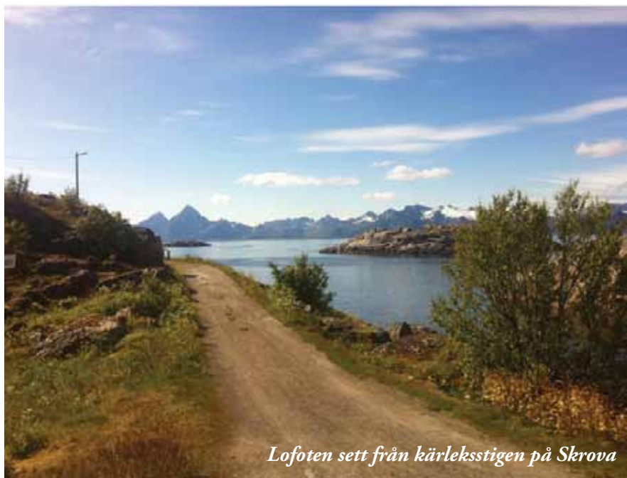
Lofoten sett från kärleksstigen på Skrova