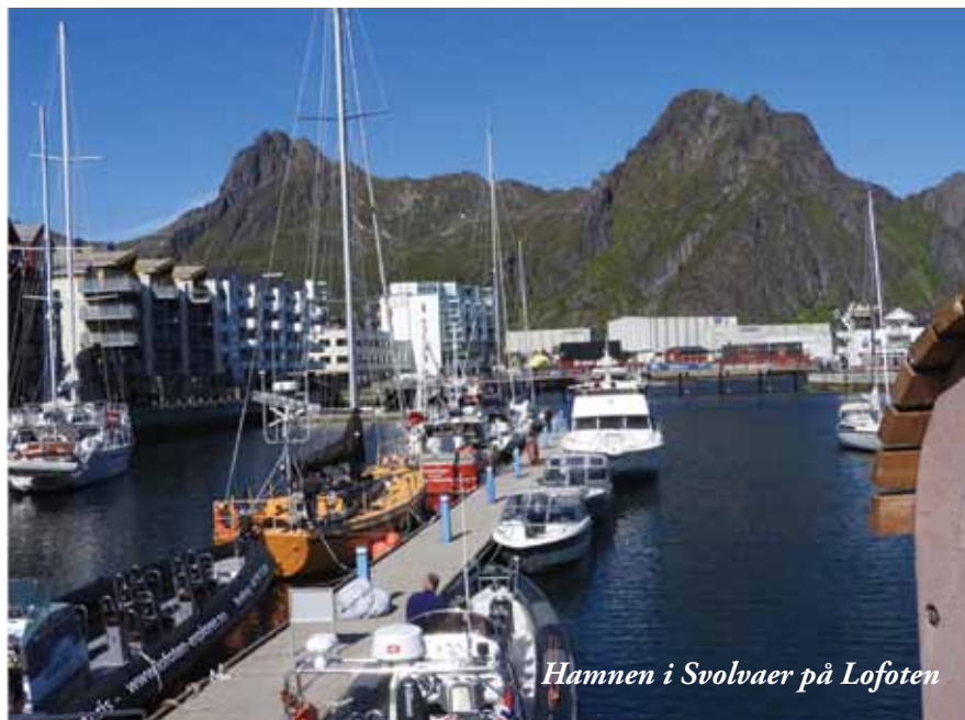
Hamnen i Svolvær på Lofoten

att vi hade mycket dåligt väder, speciellt under maj månad då Norge inte hade haft så mycket regn sedan 1949, så hade vi en härlig resa till Lofoten. Mycket vacker natur, rikt djurliv och mycket trevliga och hjälpsamma Norrrmän.