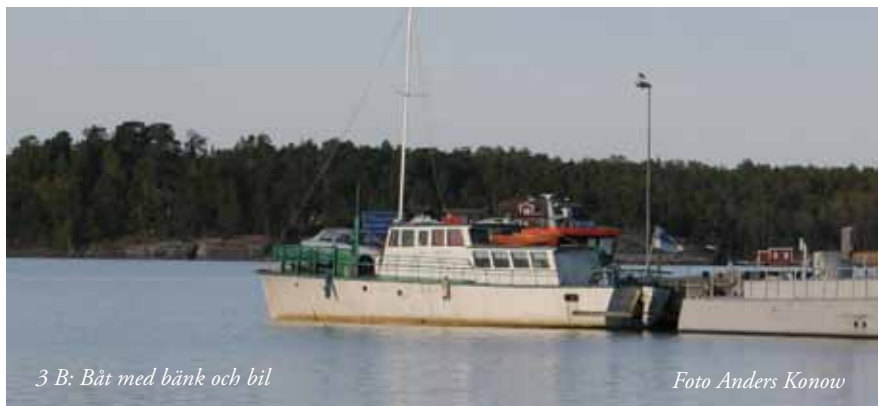
3 B: Båt med bänk och bil