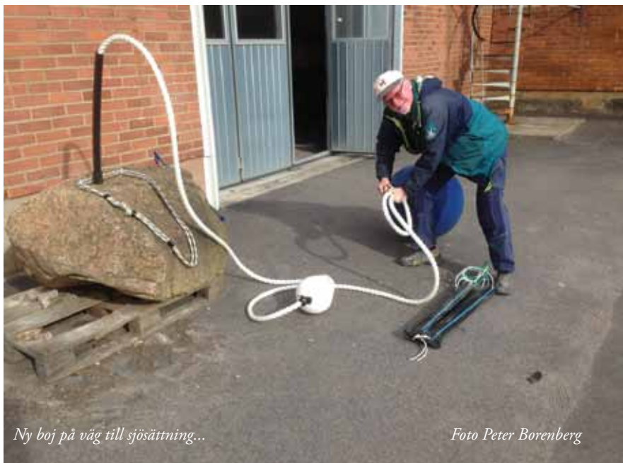
Ny boj på väg till sjösättning...