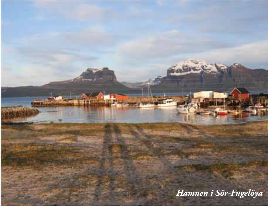
Hamnen i Sør-Fugelöya