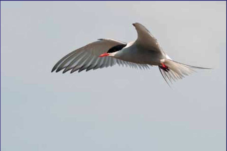
Silvertärnan - en långseglare, precis som SXX-arna