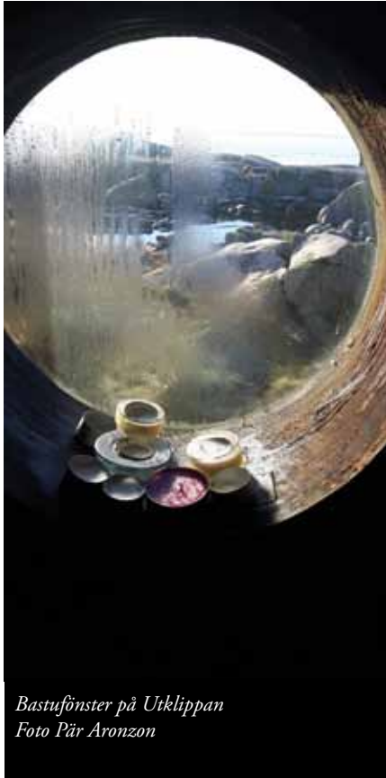
Bastufönster på Utklippan