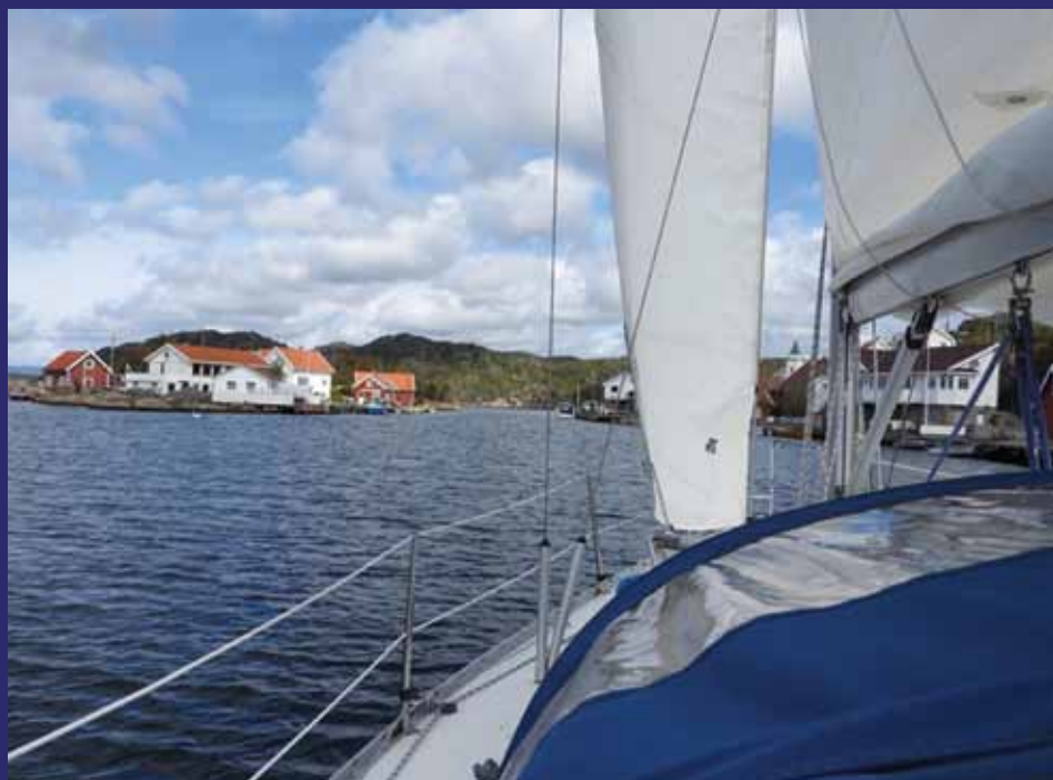
Insegling till Egersund