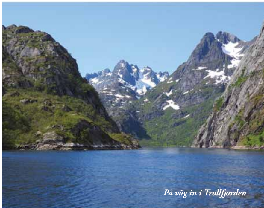
På väg in i Trollfjorden