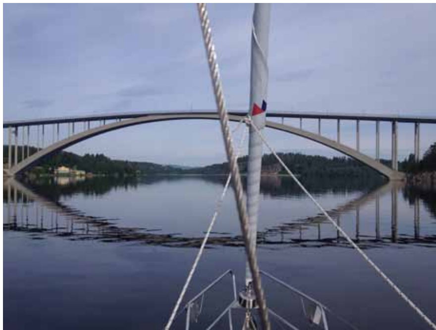
Sandöbron klar 1943

En timme senare är vi på väg upp i Ångermanälven och vi får syn på Högakustenbron, som invigdes 1997. Med en segelfri höjd på 40 m och ett vattendjup på 90 m har vi marginalerna på vår sida... Vi går lugnt för motor i 6 knop och älven ligger spegelblank. Nu går vi defintivt i mina fäders köl-vatten, eftersom min farfar var befälhavare på bogserbåten på Ångermanälven