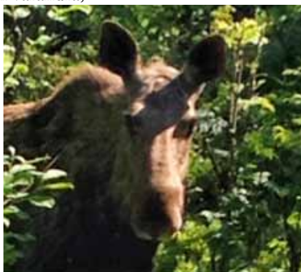
Möte i skogen på Ulvön.

in i en tät blandskog med ungbjörkar och plötsligt prasslar det till ordentligt i lövverket. Vi stelnar båda till i värmen och intill oss står en älg och mumsar löv! Den slutar äta för att istället blänga alltmer på oss inkräktare och vi undrar viskande till varandra;