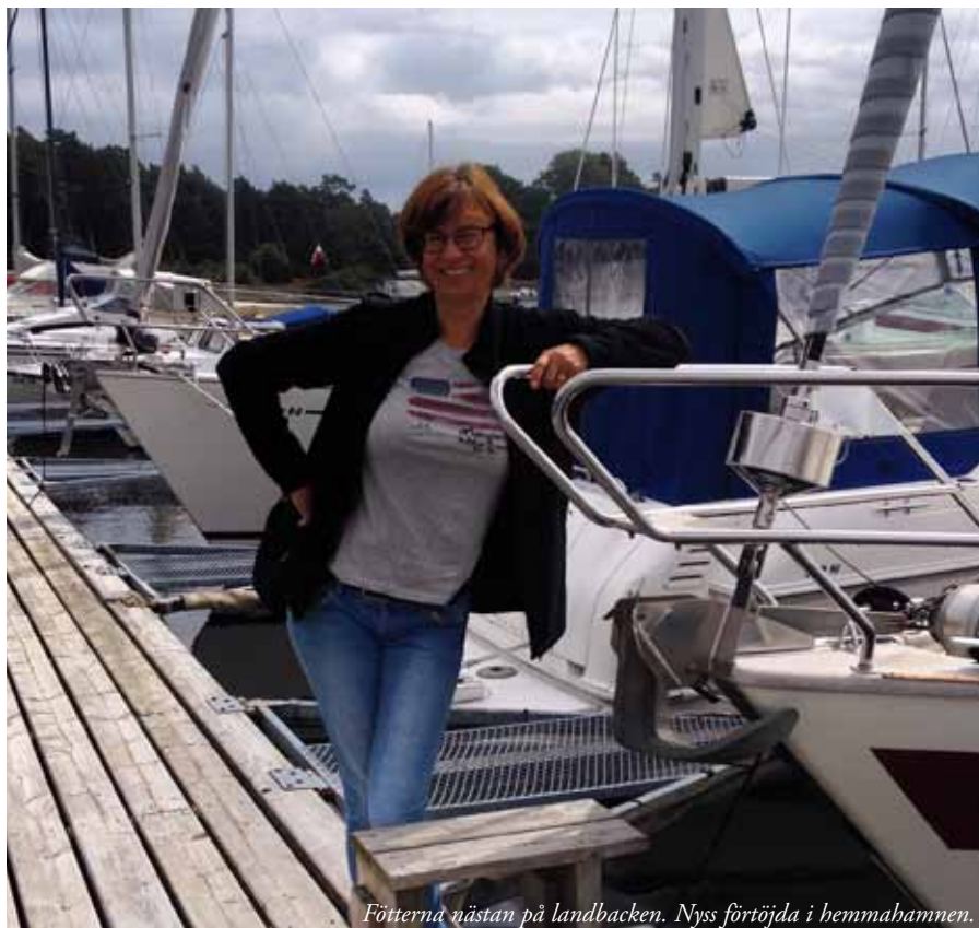
Fötterna nästan på landbacken. Nyss förtöjda i hemmahamnen.

Dagens etapp 81 sjömil. Medelfart 5,3 knop, maxfart 7,99 knop. Luftryck 994 mb. Temperatur vid hemmahamnen 14 grader. Det var dags att ta av ullkalsongerna.