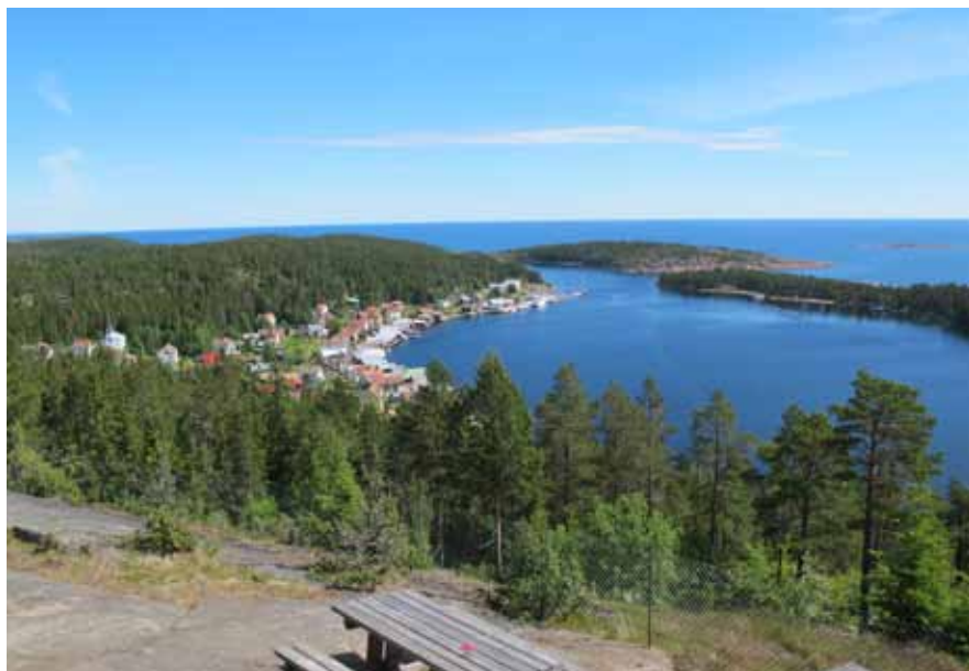
Utsikt från lotsstugan över Ulvöhamn.

in i en tät blandskog med ungbjörkar och plötsligt prasslar det till ordentligt i lövverket. Vi stelnar båda till i värmen och intill oss står en älg och mumsar löv! Den slutar äta för att istället blänga alltmer på oss inkräktare och vi undrar viskande till varandra;