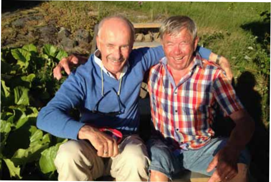
Två skeppare och mycket gemensamt att tala om.

-Nu åker vi hem till stugan och frugan och tar en kopp kaffe och sedan måste vi visa er Nordingrå från landbacken och de hamnar ni inte hinner besöka!