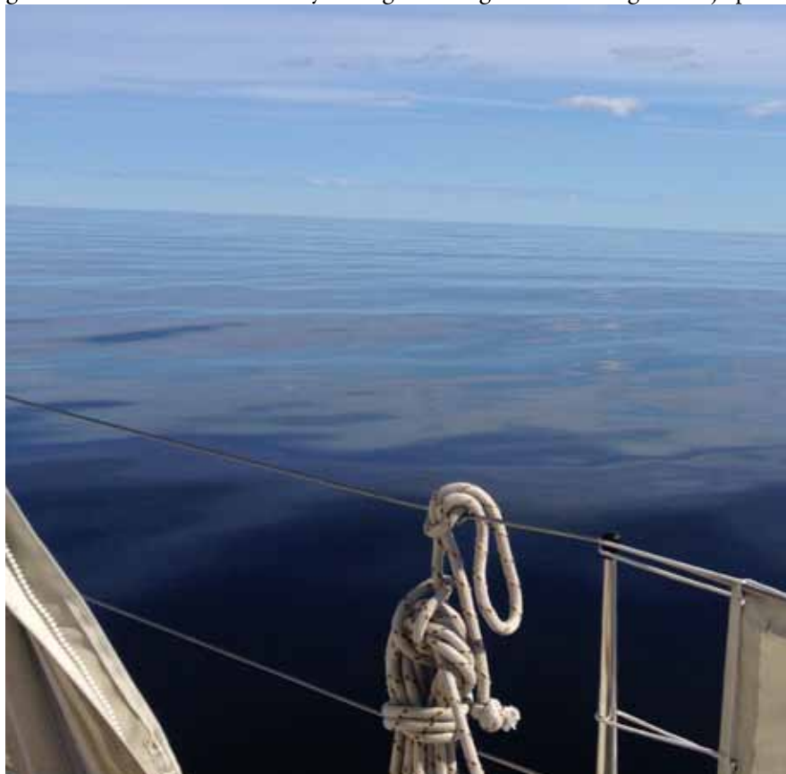
Gävlebukten eller södra Bottenhavet en förmiddag. En vision av oändligheten...

Idag är det ingen vanlig dag. Klockan är 06.30 och vi lämnar Öregrund. Solen står högt och värmer, himlen är klarblå, havet spegelblankt och vi gör entré på Bottenhavet. Men vilken sikt! Vi har lämnat luftföreningarna bakom oss och plötsligt blivit begåvade med falkögon. Sannolikt är det så att vi får in föroreningar med vindarna från kontinenten och Brittiska öarna, som ger oss mer eller mindre dis i sydsverige. Våra egna storstadsregioner hjälper