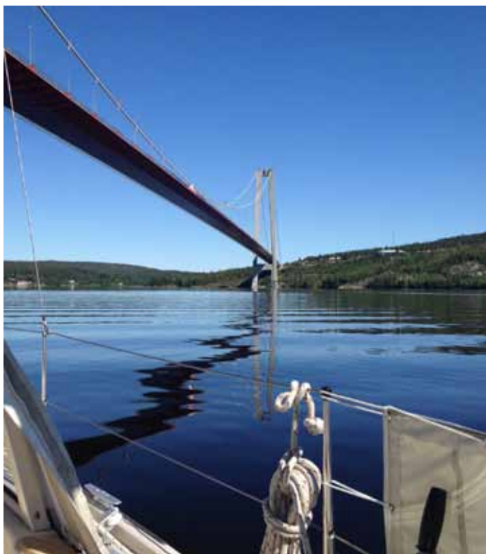
Högakustenbron klar 1997

Efter en lugn natt var det dags att ta sig an den nyckfulla Åvikebukten. Innan dess passerade vi Rödön, som var lika röd idag som för ett halvsekel sedan, då min pappa med sin passbåt och 25 hkr Evinrude utombordare hämtade sten till stenpartiet hemma i trädgården. Jag antar att preskriptionstiden har gått ut. Idag satte inte Åvikebukten oss på några större prov än gammal sjö och äntligen skulle vi närma oss det slutliga målet för seglatsen, landskapet Ångermanland och Högakusten. En mer välkommen entre är svår att hitta än att gå upp genom Södra sundet mot Härnösand. Nu lämnade vi havet ett par dagar för att botanisera inomskärs. Vi förtöjde vid en av Härnösands tre gästhamnar, Kanaludden med nya y-bommar, flytpontoner som ändades med en badbrygga, som ungdommarna flitigt använde trots 13 grader i vattnet.