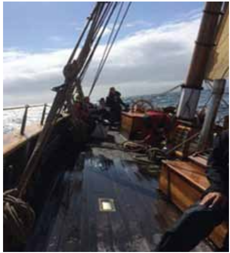
Atlantica gick tungt och säkert i den tidvis hårda vinden och grova sjön.